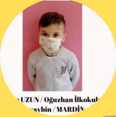
UZUN / Oğuzhan İlkokulu Nusaybin / MARDİN